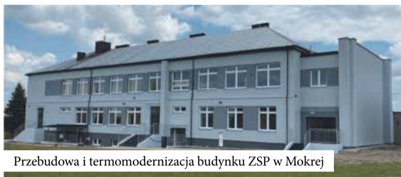
Przebudowa i termomodernizacja budynku ZSP w Mokrej

Ubiegły rok był szczególnie pod kątem inwestycji. Suma wydatków przeznaczonych na zwiększenie majątku publicznego wyniosła 16.356.455,36 zł, czyli prawie dwa razy tyle ile w roku 2021. Na tak duży wzrost wydatków majątkowych wpływ miało także objęcie udziałów w spółce SIM