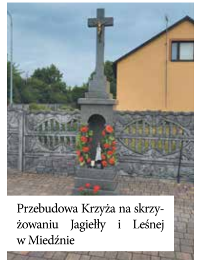
Przebudowa Krzyża na skrzyżowaniu Jagiełły i Leśnej w Miedźnie

W lutym 2022 roku rozpoczęło się drugie, podobnie skonstruowane zadanie inwestycyjne obejmujące swym zasięgiem kompleksową przebudowę większości dróg gminnych w sołectwie Borowa. Jego wartość to blisko 8,3 mln złotych. Również ono uzyskało dofinansowanie z Rządowego Funduszu Budowy Dróg Lokalnych (4.705.059,50 zł –