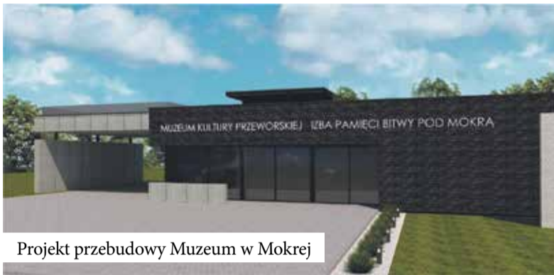
Projekt przebudowy Muzeum w Mokrej