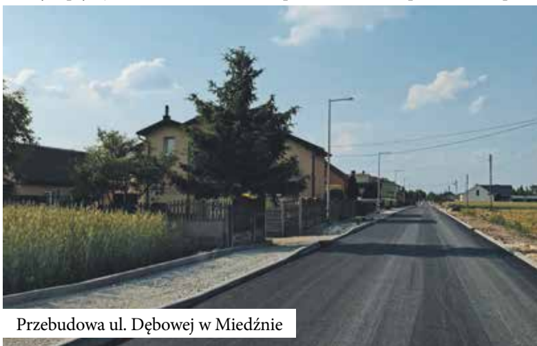
Przebudowa ul. Dębowej w Miedźnie

Wykonanie założonych dochodów budżetu w wysokości 89,96 proc. wynikało głównie z niezrealizowania w pełni planu dochodów majątkowych. Wiązało się to z przedłużającymi się, z powodów niezależnych od nas, procedurami rozliczeń zrealizowanych i zakończonych zadań inwestycyjnych. Dochody te powinny wpłynąć do budżetu w roku