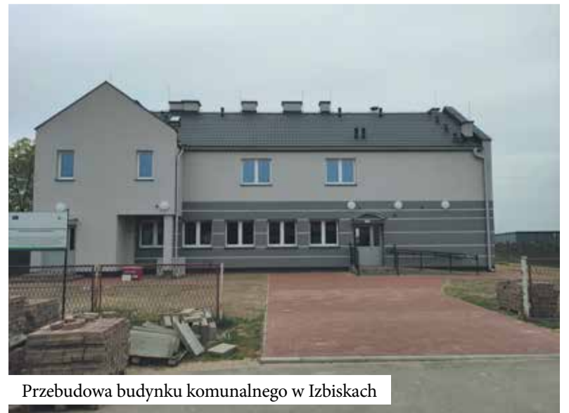
Przebudowa budynku komunalnego w Izbiskach