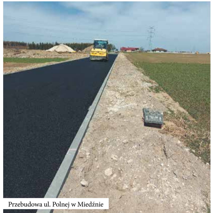
Przebudowa ul. Polnej w Miedźnie

„Modernizacja trybun na boisku sportowym im. Ludwika Bodzichowskiego w Miedźnie”. Zadanie zostało sfinansowane z grantu udzielonego gminie przez samorząd województwa w konkursie „Inicjatywa Sołecka” oraz środków z budżetu Gminy Miedźno zabezpieczonych w ramach funduszu sołeckiego. Dzięki nim zakupiono i zamontowano na obiekcie nową trybunę modułową. Do projektu rzeczowy wkład pracy wnieśli ponadto działacze użytkownika obiektu KS „Grom Miedźno” oraz wspierające z klubem firmy, które użyczyły sprzęt i zabezpieczyły materiały budowlane na wykonanie podbudowy pod wzniesienie konstrukcji.