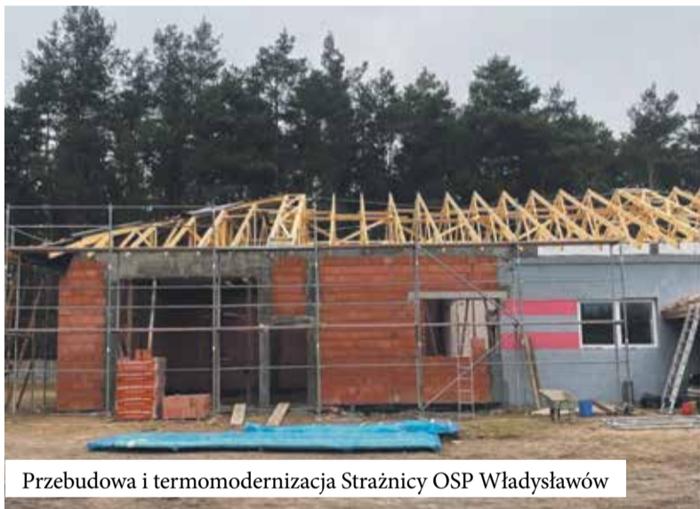
Przebudowa i termomodernizacja Strażnicy OSP Władysławów

Obecne pomieszczenia są zbyt małe by pomieścić dwie stałe ekspozycje dotyczące bardzo różnych okresów historii Mokrej. W ramach projektu planuje się dobudowanie sali konferencyjnej, zaplecza socjalnego, tarasu widokowego ułatwiającego prezentację przebiegu bitwy pod Mokrą dla grup zorganizowanych. Przebudowane zostanie obecne wnętrze budynku. Tak, aby pełniej spełniało wymagania stawiane obiektom muzealnym. Wygospodarowana także w nim zostanie przestrzeń dla filii Biblioteki Publicznej. Budynek uzyska także instalację fotowoltaiczną i nowoczesne ogrzewanie, które zastąpi obecne przyłącze do instalacji centralnego ogrzewania w ZSP Mokra, co powinno obniżyć koszty jego funkcjonowania.